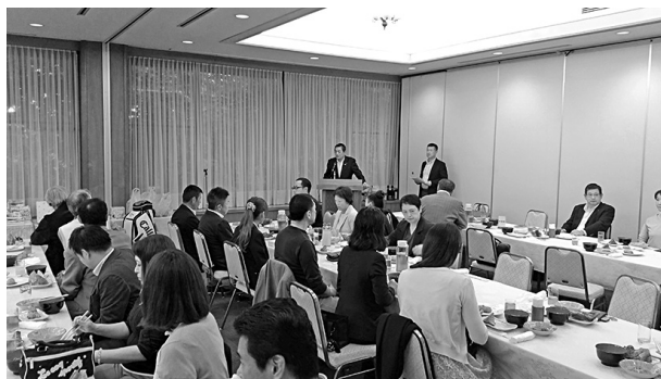
立川市民大会の表彰風景