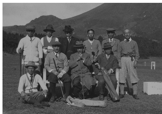
往時のプレー風景(上)