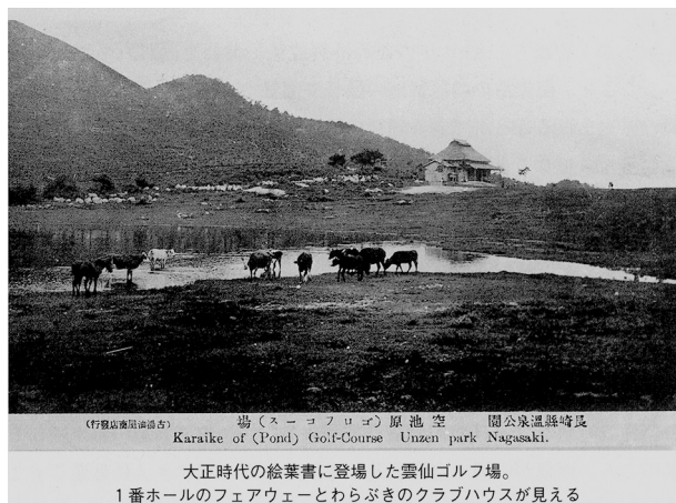
初期の雲仙ゴルフ場写真 (Brian Burke-Gaffney著・平 美雪訳(2003)「グラバー家の人々 花と霜」長崎文献社 より)

当時の日本には、神戸の「六甲コース」(1903)と「横屋コース」(1904)、関東では「横浜根岸コース」(1906)の3コースがありましたが、長崎にはコース造成の専門家はおろか、ゴルフを知る日本人さえ稀でした。このため、ゴルフコースの設計は富三郎が勤務するリンガー社のイギリス人、バックランドとウォーレスが担当し、1911年6月に着工しました。そして、2年の歳月をかけて1913年8月14日に9ホールが完成し、名称を「雲仙ゴルフリンクス」としてオープンしました。開場後1年間のゴルフ入場者は288名でしたが毎年減少の一途を辿り、「大正8(1919)年はわずか16人に」という記事が、長崎新聞に掲載された「長崎県スポーツ史」(1987年4月10号)に記されています。これに関して、長崎県立図書館に保存されている当時の入場者記録帳を見ると、夏季は雲仙を訪れる観光客が多いため、ゴルフ場やテニスコートの入場者が多いものの、11月中旬から4月後半までの寒冷期には極端に入場者が減少する状況が一目瞭然に分かります。