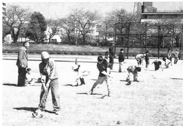
スナッグゴルフ講習会にて