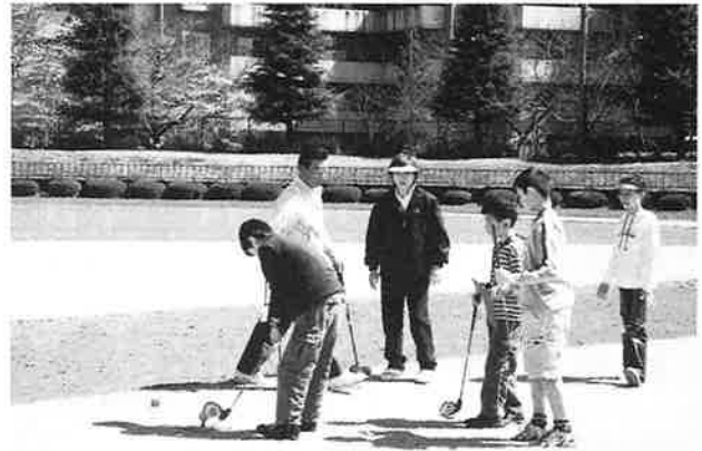
スナッグゴルフ講習会にて